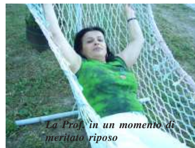
La Prof. in un momento di meritato riposo